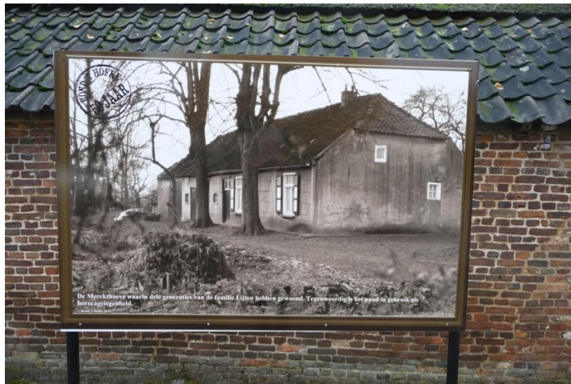
De Merckthoeve aan de Oude Urkhovenseweg waarin drie generaties van de familie Lijten hebben gewoond. Het pand was tot voor kort in gebruik als horecagelegenheid. Momenteel staat het leeg.

In Tongelre is het project ROND 'T HOFKE in 2014 opgezet bij het 50-jarig jubileum van het gelijknamige wijkblad. Een tiental panelen tonen oude foto's met beschrijvingen van (verdwenen) monumenten en karakteristieke gebouwen in de voormalige gemeente Tongelre. Dit project heeft als voorbeeld gediend voor ons project TERUGBEELD.