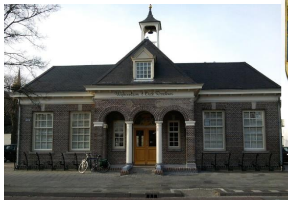
Het oude raadhuis van Tongelre met het wapen van Tongelre

De gemeente Tongelre heeft bestaan tot 1 januari 1920, toen de gemeente (groot) Eindhoven werd gevormd uit de gemeenten Eindhoven (stad), Gestel en Blaarthem, Strijp, Stratum, Tongelre en Woensel.