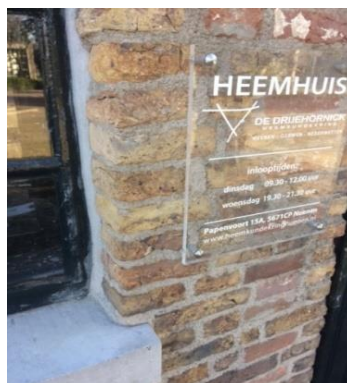
Erna: de kieren zijn gedicht