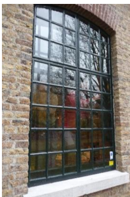
Voor de behandeling

Nadat in november 2018 BAN-bouw aan de binnenzijde van ons Heemhuis voorzetramen heeft aangebracht, werd onze hoop bewaarheid en daalde het gasverbruik met ruim 30%. De tocht, die veroorzaakt wordt door de kieren langs de stalen kozijnen, is desondanks gebleven. Onlangs zijn alle kieren langs de stalen kozijnen aan de buitenkant van het Heemhuis met cement afgewerkt. Alleen het raam rechts van de ingang is niet behandeld, maar dat was niet nodig omdat het oude cement er nog goed uitziet. Jammer dat het Heemhuis voorlopig vanwege de coronacrisis gesloten moet blijven. Anders hadden we kunnen kijken (of beter kunnen voelen) of het dichten van de kieren aan de buitenkant inderdaad de tocht buiten houdt.