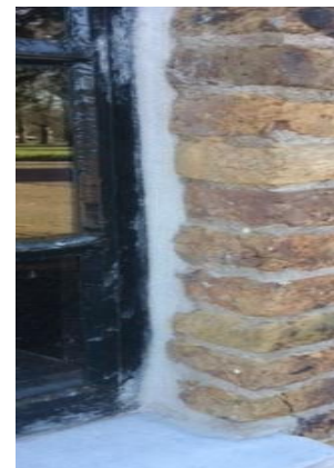
Een verticale 'cementen' streep loopt langs de stalen kozijnen