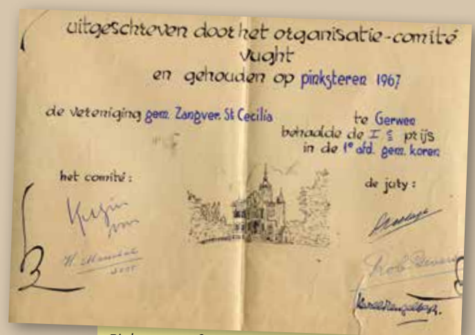
Pinksteren 1967, de eerste prijs op een internationaal zangconcours