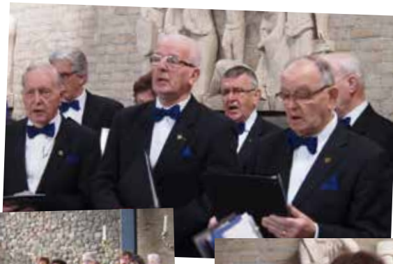
Het laatste optreden, 23 april 2017