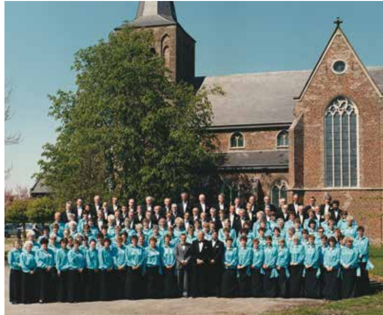
Het koor, één eeuw oud

Ter gelegenheid van het 100-jarig jubileum zal op 4 november 1988 in Gerwen een korenfestival gehouden worden waaraan alleen Nuenense koren zullen deelnemen: het Nuenens Kamerkoor, het seniorenkoor 'De Vrolijke Samenhang', het K.V.O.-koor, gemengde zangvereniging 'De Vankklank' en uiteraard het 'Gerwens Gemengd Koor St. Caecilia'.