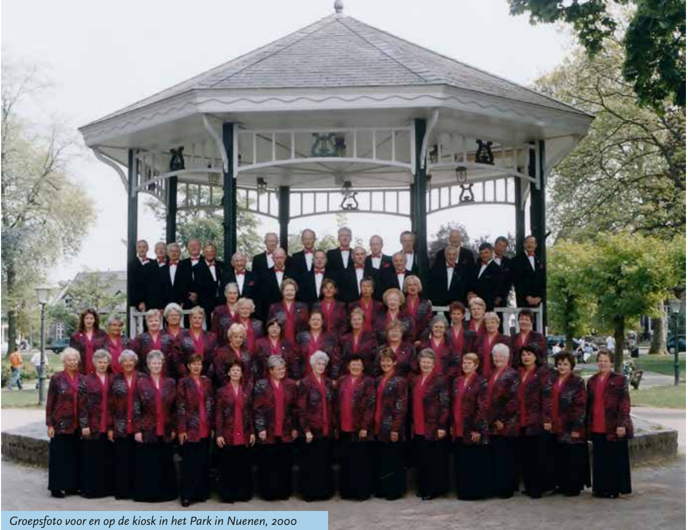
Groepsfoto voor en op de kiosk in het Park in Nuenen, 2000

Het inmiddels op leeftijd en daarmee stevig vergrijsd koor onderneemt een poging om het ledenbestand te verjongen. Op 5 juli 2001 stelt het koorbestuur in Rond de Linde: 'Als jongeren vanaf 25 tot 40 jaar zich aanmelden wil het bestuur met hen om de tafel gaan zitten om met medewerking en supervisie van het G.G.K. een eigen koor op te richten' . Dit initiatief heeft geen verder vervolg gekregen.