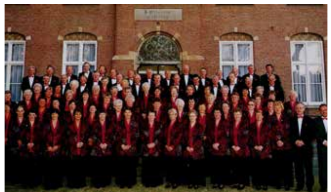
Het in nieuwe kleding gestoken koor voor het Klooster, 1998

In 1998 wordt het 110-jarig bestaan van de zangvereniging gevierd met een uitvoering van een licht klassiek concert in het Muziekcentrum Frits Philips in Eindhoven in samenwerking met de Eindhovense orkestvereniging Helikon. Van dit optreden is tijdens de uitvoering een CD-opname gemaakt. Op de jubileumdag tijdens een feestelijke eucharistieviering in de St. Clemenskerk te Gerwen wordt de Krönungsmesse van Mozart uitgevoerd.