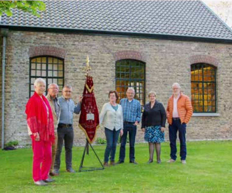
Het bestuur draagt op 10 mei 2017 voor het Heemhuis het vaandel officieel over aan de heemkundekring

Het totale archief zoals krantenknipsels, jaarverslagen, programmaboekjes, ledenlijsten en veel foto's en fotoboeken is officieel overgedragen aan heemkundekring De Drijehornick. Ook de muziekstandaard, aangeboden bij het honderdjarig bestaan van het koor in 1988 werd aan de heemkundekring overgedragen.