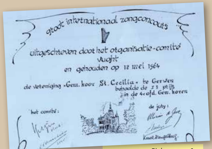
Pinksteren 1964, de eerste prijs in de 4e afdeling