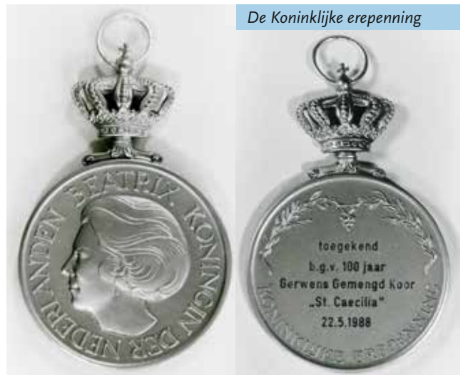
De Koninklijke erepenning

Ter gelegenheid van dit jubileum krijgt het koor erkenning van de rijksoverheid. Op 25 januari 1988 wordt het koor koninklijk onderscheiden: 'Wij Beatrix, bij de gratie Gods, Koningin der Nederlanden, Prinses van Oranje-Nassau, enz. enz. enz. hebben besloten en beschikken: de Koninklijke erepenning toe te kennen aan: Gerwens Gemengd Koor "St. Caecilia" te Gerwen wegens: het 100-jarig bestaan in 1988. De Grootmeester van ons huis is belast met de uitvoering van deze beschikking. (Get.) Beatrix