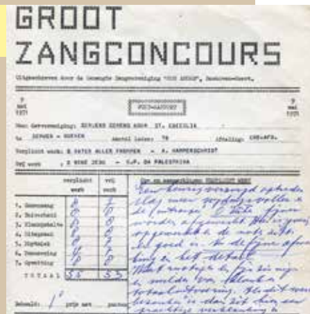
9 mei 1971, juryrapport groot zangconcours Weert