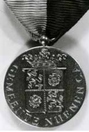
De gouden erepenning van de gemeente Nuenen c.a.

Burgemeester en wethouders van de gemeente Nuenen c.a. blijven niet achter en kennen aan het 'Gerwens Gemengd Koor St. Caecilia' wegens uitzonderlijke verdiensten de erepenning in goud van de gemeente Nuenen, Gerwen en Nederwetten toe.