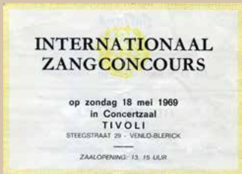
18 mei 1969, de eerste prijs in de afdeling Uitmuntendheid

'Natuurlijk brengt het Gerwense koor ook de beide nummers, waarmee zij op het concours in Blerick, in de afdeling uitmuntendheid met 376 punten de eerste prijs behaalden met lof der jury, hetgeen inhield promotie naar de Ere-afdeling'.