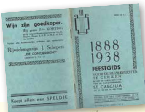
Omslag feestgids 1938

In het jaar van het jubileumfeest is de dreiging van de Tweede Wereldoorlog al voelbaar en wordt op 10 mei 1940 werkelijkheid. Over hoe het koor de oorlogsjaren is doorgekomen is weinig bekend, maar daarna heeft het koor in 1948 het 60-jarig bestaan gevierd op 25 april en 2 mei 'met een groot festival (...) waaraan ook diverse kermisvermakelijkheden verbonden zijn (...)' .