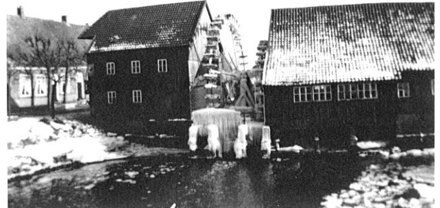
Toen waren winters nog echt koud...